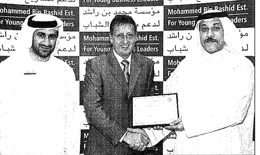
عقب توقيع الاتفاقية